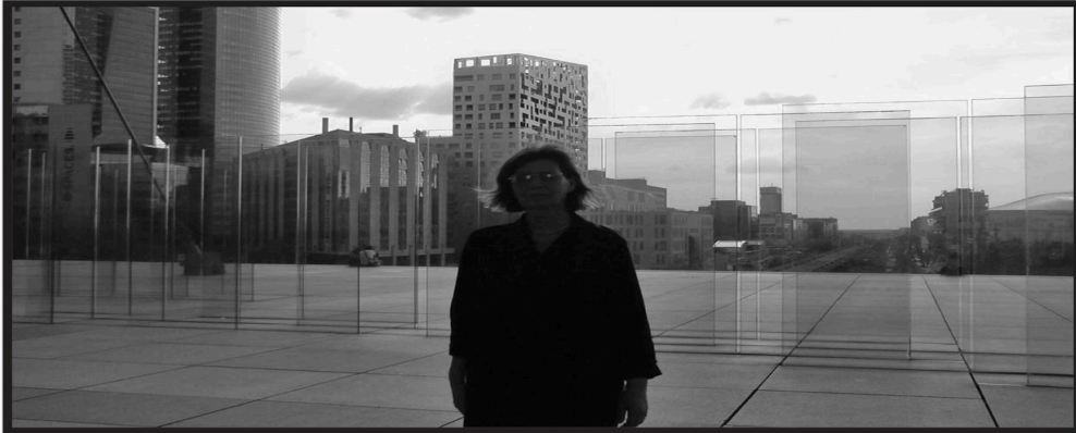
Παρίσι / Paris 2022